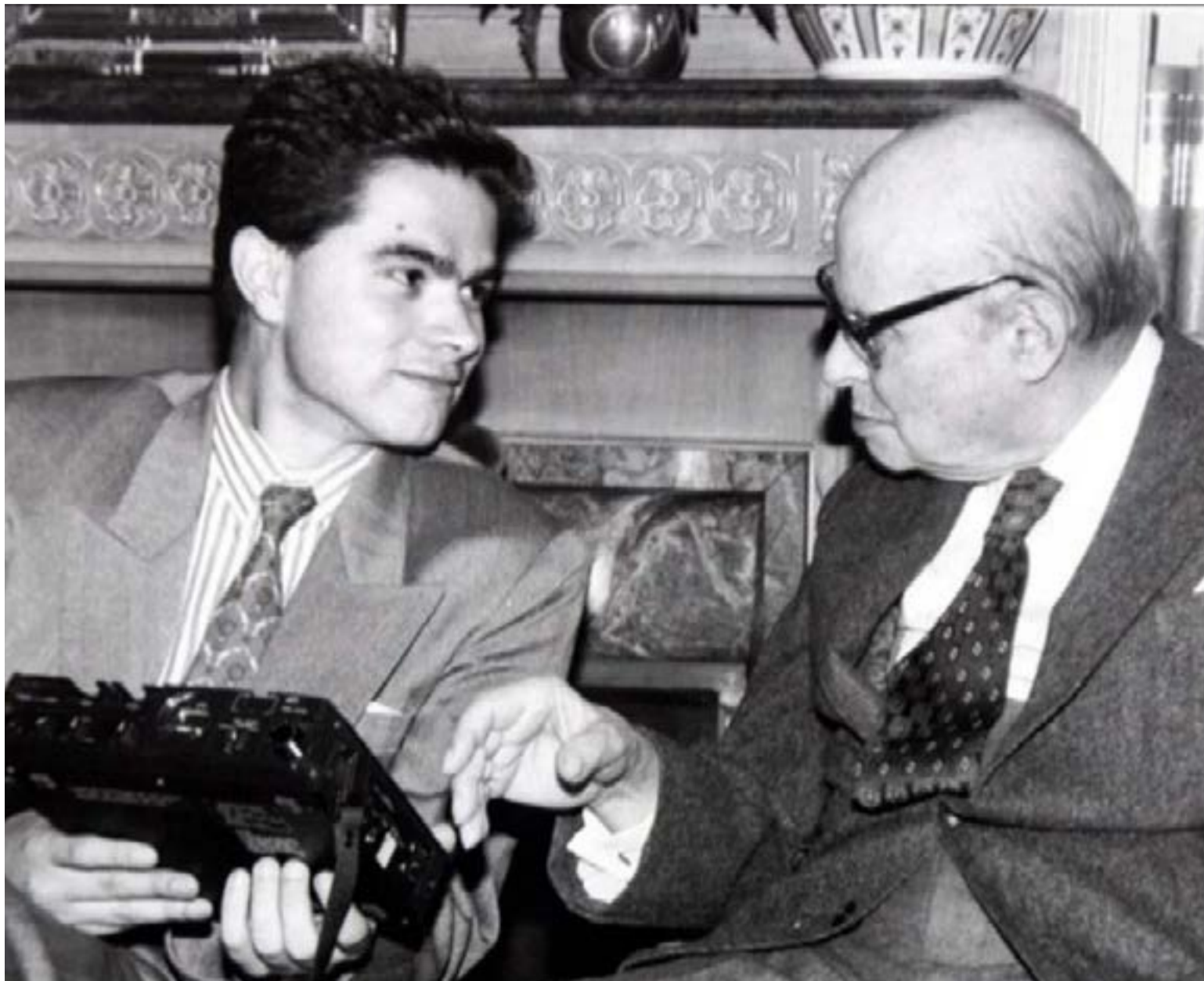
Germán Vargas Lleras y su abuelo, el expresidente, Carlos Lleras Restrepo.