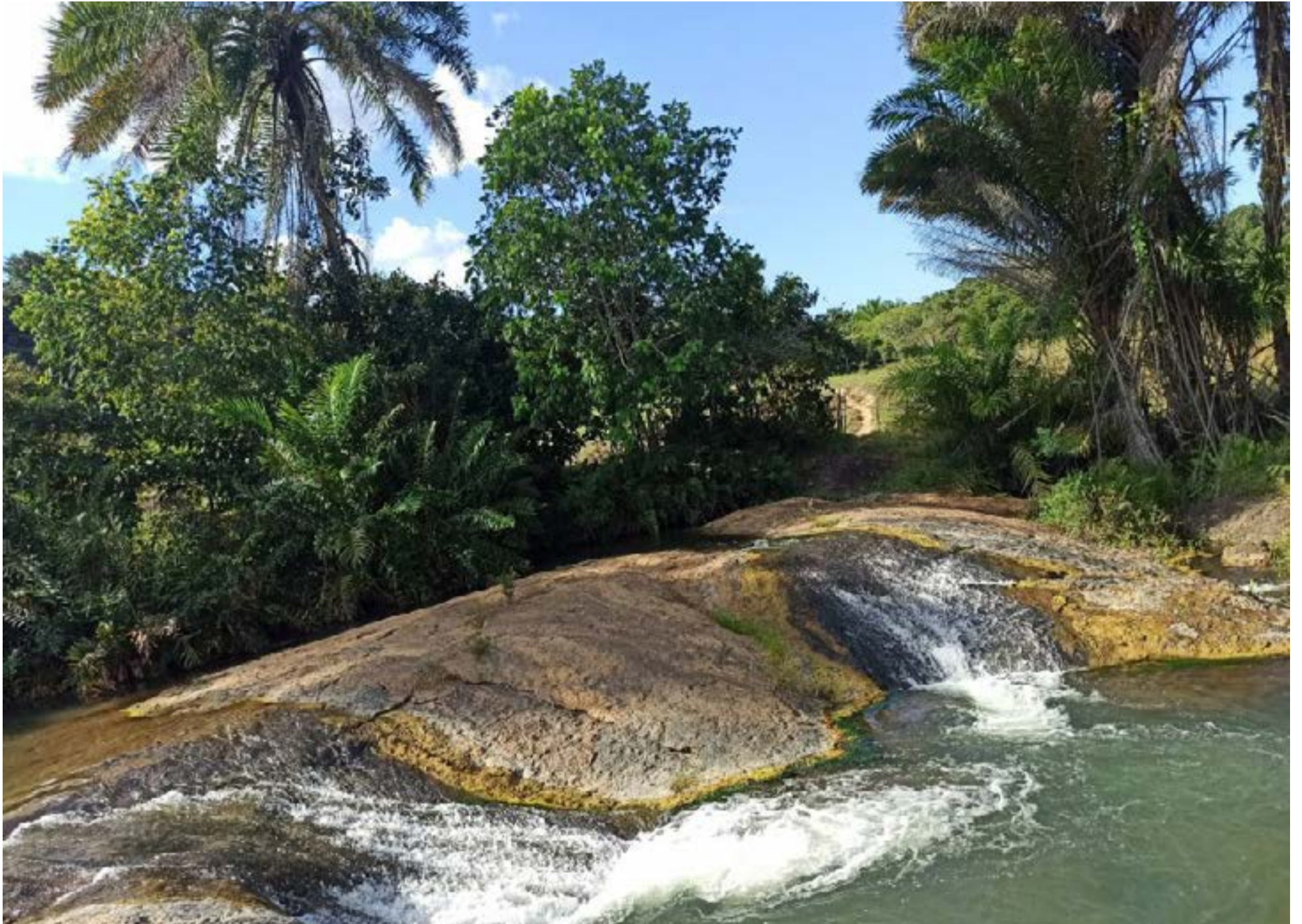
Santa Luzia es un municipio brasileño del Estado de Bahía