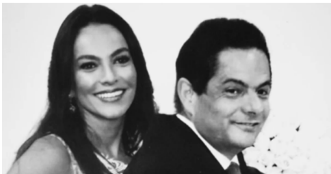
Germán Vargas Lleras y su esposa, Luz Marina Zapata, estuvieron casados por más de 20 años.

Se espera que durante la jornada de mañana se mantengan estrictos dispositivos de seguridad en el centro de Bogotá debido a la asistencia masiva de líderes políticos y representantes del Gobierno Nacional.