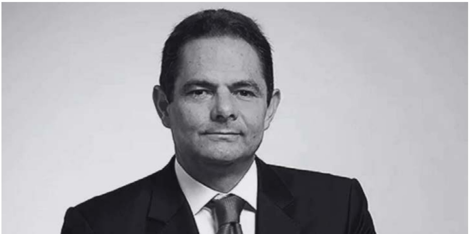
Germán Vargas Lleras (Q.E.P.D.)