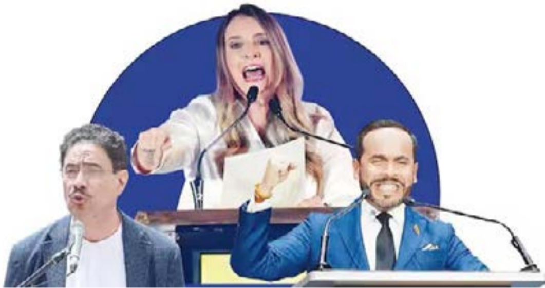
Un informe del Servicio de Investigación del Congreso de Estados Unidos analizó a los principales aspirantes presidenciales, destacando el perfil de Iván Cepeda como el más favorable.

El informe analiza cómo figuras vinculadas al expresidente Álvaro Uribe, como Paloma Valencia, que representan la resistencia al modelo de