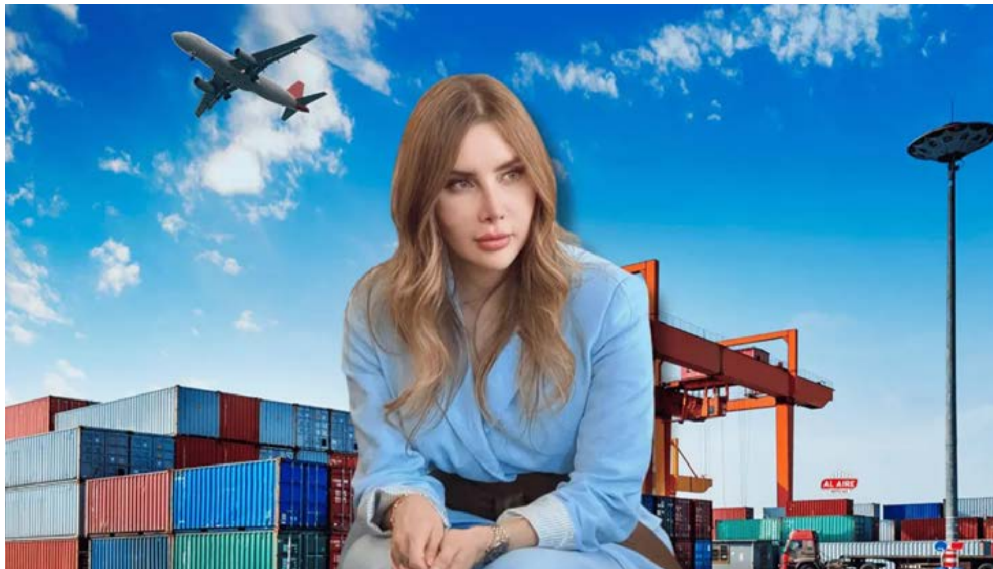
Diana Marcela Morales Rojas ministra de Comercio, Industria y Turismo de Colombia, responsable del crecimiento de las exportaciones industriales.