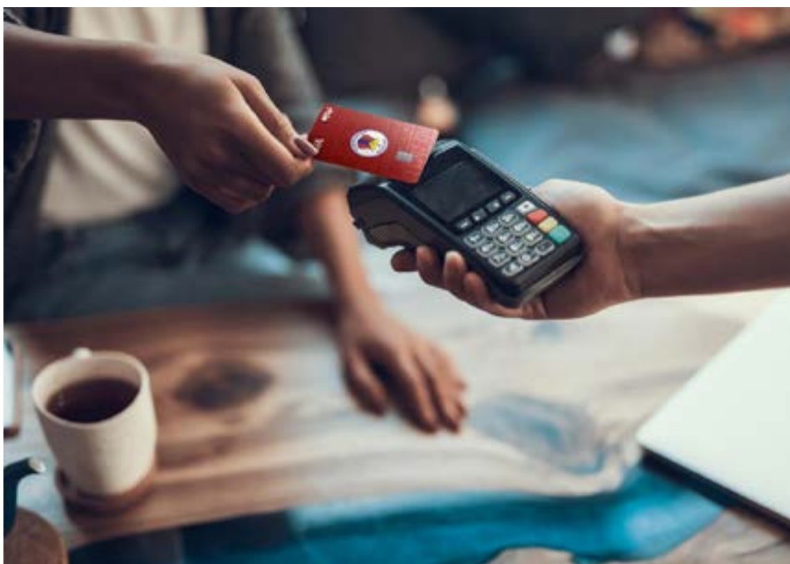
La billetera digital de Grupo Aval y Deportivo Pasto presentan una tarjeta edición especial que conectará a los aficionados del equipo volcánico.

Con esta tarjeta, los +1.200.000 seguidores del equipo volcánico podrán acceder a beneficios como descuentos en boletería, experiencias relacionadas con el club