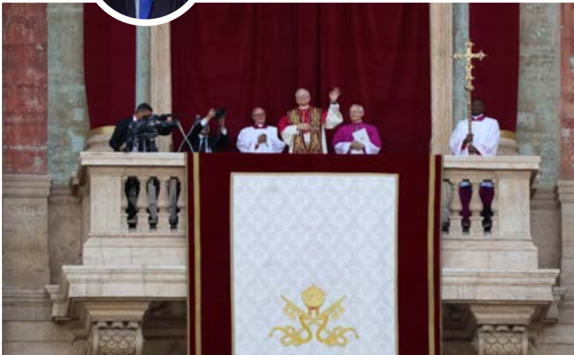
Papa León XIV (anteriormente Cardenal Robert Prevost, elegido el 8 de mayo de 2025 tras el fallecimiento de Francisco)

A un año de la elección del Papa León XIV (anteriormente Cardenal Robert Prevost, elegido el 8 de mayo de 2025 tras el fallecimiento de Francisco), el balance de su primer año, a fecha de mayo 2026, se caracteriza por un perfil de «equilibrista» que busca la unidad y la paz en un mundo convulso, consolidando su estilo moderado.