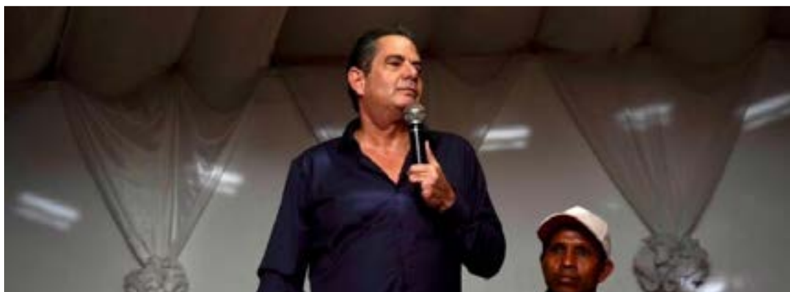
Germán Vargas Lleras, candidato presidencial.