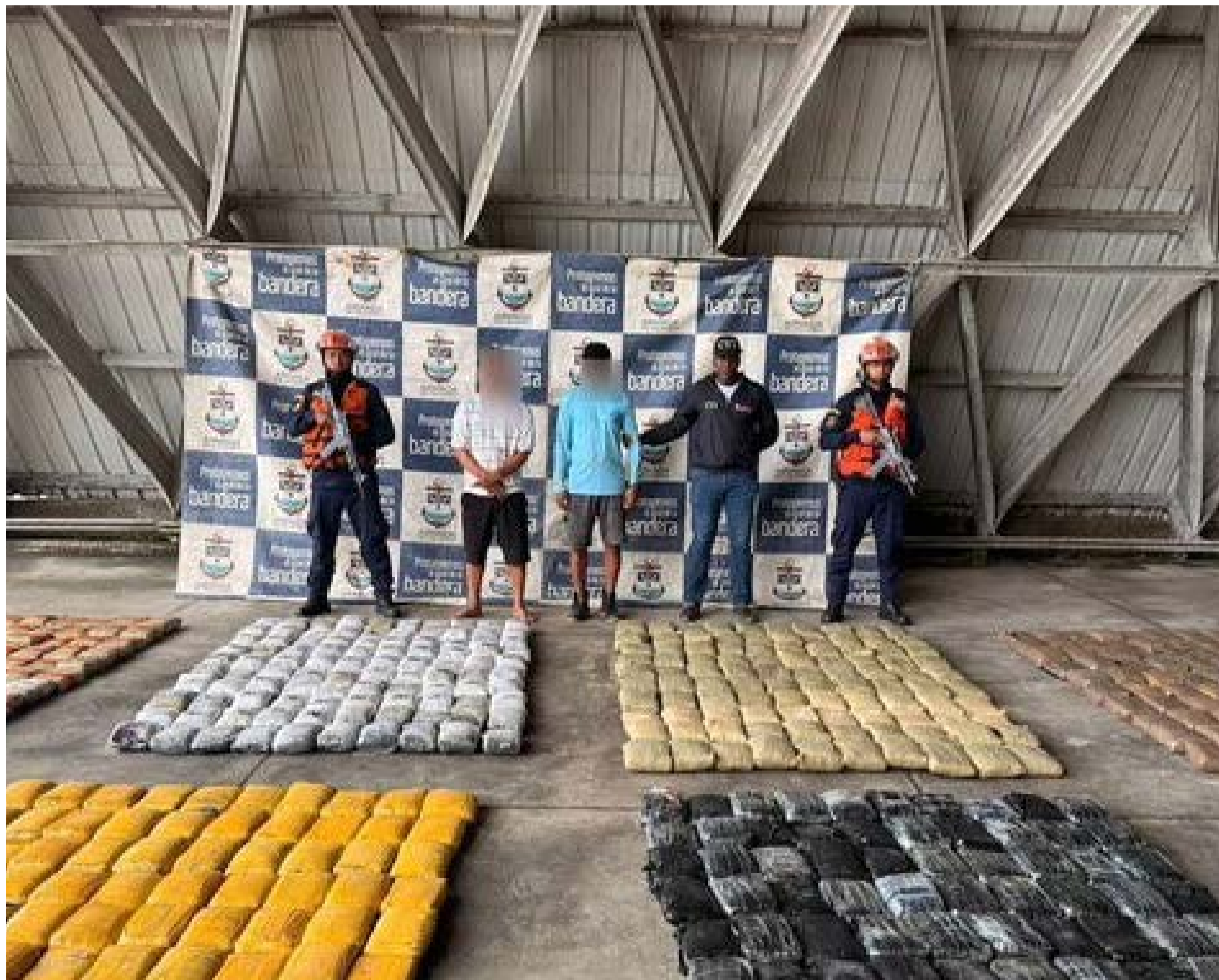
La Armada Nacional incauta más de 5,8 toneladas de drogas en el Pacífico. la droga era de la Junta Directiva del narco tráfico.