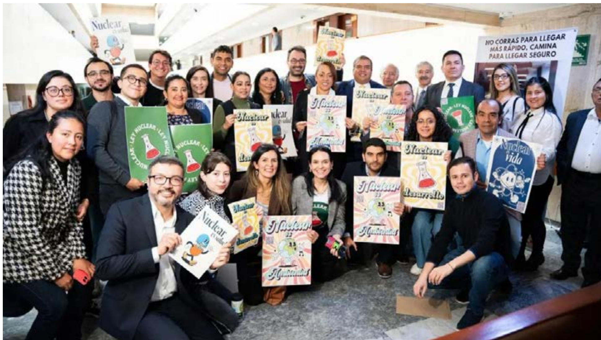
Ley Nuclear crea la ANSN y establece marco de seguridad para radioterapia y medicina nuclear optimizando diagnóstico y tratamiento oncológico.